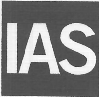
King Cert International Certification Ltd. Director

ACCREDITED Management Systems Certification Body MSCB-196